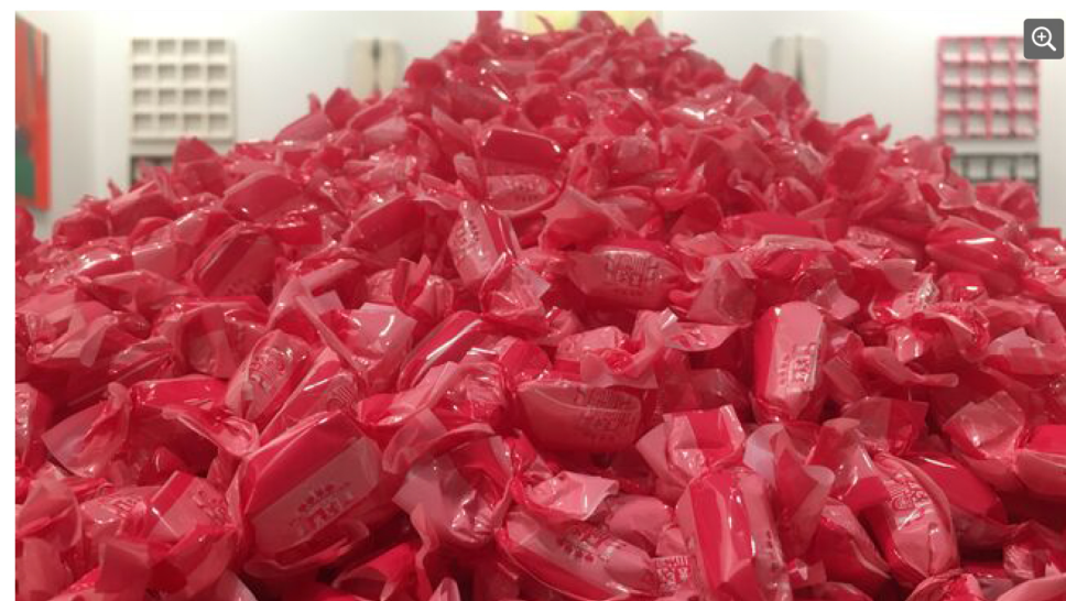
Els caramels de l'obra 'El requeriment', d'Esvin Alarcón Lam / A.R.

Les pintures d'Antoni Tàpies (1,5 milions) i Lluís Hortalà, a les galeries Mayoral i Rocío Santa Cruz, compleixen les expectatives de les seves gegantines dimensions. La d'Hortalà porta per títol Davant la llei (160.000 euros) i és fruit d'un subtil joc conceptual: "Vull posar les tècniques antigues al servei de la contemporaneïtat", diu Hortalà. Mentre Lluís Hortalà juga amb les convencions de la pintura, el fotògraf Jordi Bernadó trenca les del retrat a la galeria Senda: els protagonistes del seu Projecte ID , que es podrà veure l'any que ve al Museu Nacional d'Art de Catalunya, entre els quals hi ha Woody Allen i Stephen Hawking, sempre apareixen d'esquena, i el protagonisme el tenen els llocs on van ser retratats, triats per ells mateixos.