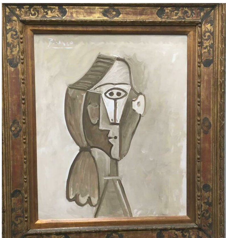
Retrato de Jacqueline Picasso de Pablo Picasso