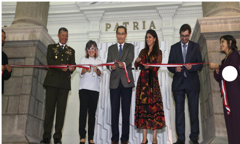
Inauguración de la feria Art Lima 2019.