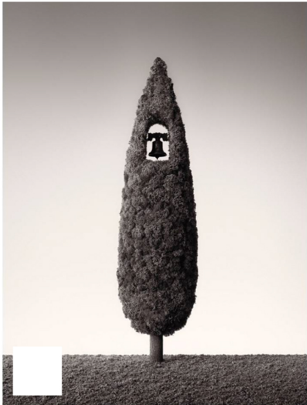
Sin título, 2018. Galería Elvira González CHEMA MADDOZ