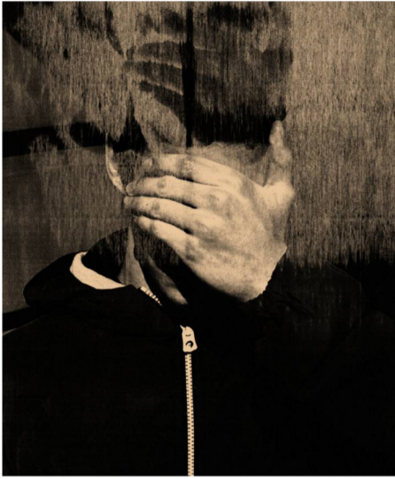
Hugo (Figure #2). 2015, 2019. UN-SPACED THOMAS HAUSER / UN-SPACED GALLERY

Dentro de su espacio, The Dreadful Details , una pieza de Eric Baudelaire atrae la atención de un numeroso público. Se trata de una imagen que escenifica una guerra. "Está hecha en un plató cinematográfico con actores", explica la galerista. "Una imagen que muestra lo espeluznante de la guerra como concepto. El drama de las familias que huyen, los medios tratando de captar una imagen, la muerte, el terror, la barbarie, todo queda muy bien plasmado. Sería demasiado cruel que la imagen fuese real y tener que venderla. De ser real tampoco hubiese sido tan perfecta, ni tan poética ni artística". Entre los artistas representados nos encontramos con Montserrat Soto, reciente Premio Nacional de Fotografía, con Alicia Framis y con una obra con tintes pictóricos de Cristina García Rodeo, que hace uso del color en su serie sobre la India. Cristina de Middel presenta una obra donde rinde homenaje a la mujer africana como sustento fundamental, familiar y social.