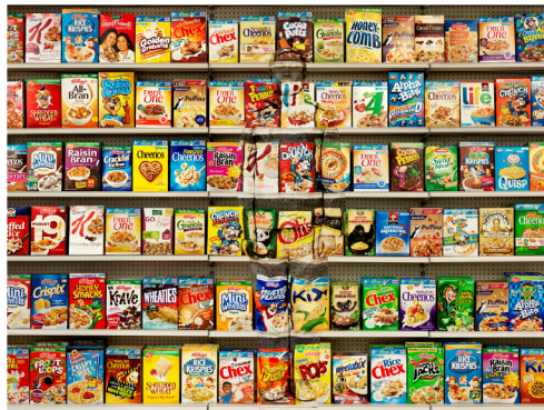
Liu Bolin, Hiding in New York No. 8 - Cereal 2013.

El booth de la galería mexicana RGR+ Art presenta piezas de Hiding in the City , una de sus series fotográficas más conocidas, la cual comenzó en 2005 después de la destrucción de su estudio en Beijing a manos de agentes del gobierno chino, a raíz de una serie de discrepancias políticas. Ante esta situación, Bolin decidió tomar la ciudad como un catalizador de experiencias, para comprender distintos ámbitos de la realidad política y social en distintas partes del mundo.