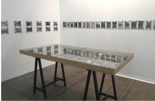
Vista general de booth anónimo en Zona MACO FOTO 2018.

La participación más curiosa en esta edición de la feria corresponde al booth anónimo ZMS34, que aloja una selección de fotografías de archivo realizadas aproximadamente entre 1940 y finales de 1960. El conjunto fotográfico muestra escenas de daños ocasionados en cines del Estado de México y Puebla, como el Cine Guerrero o el Cine Coliseo. Algunas fotos están intervenidas con líneas de color con las que un autor anónimo señaló las alteraciones dentro de los espacios, los cuales presentan indicios de disturbios: este último dato lo sugiere la presencia de elementos de seguridad pública y militares en las entradas de los cines fotografiados.