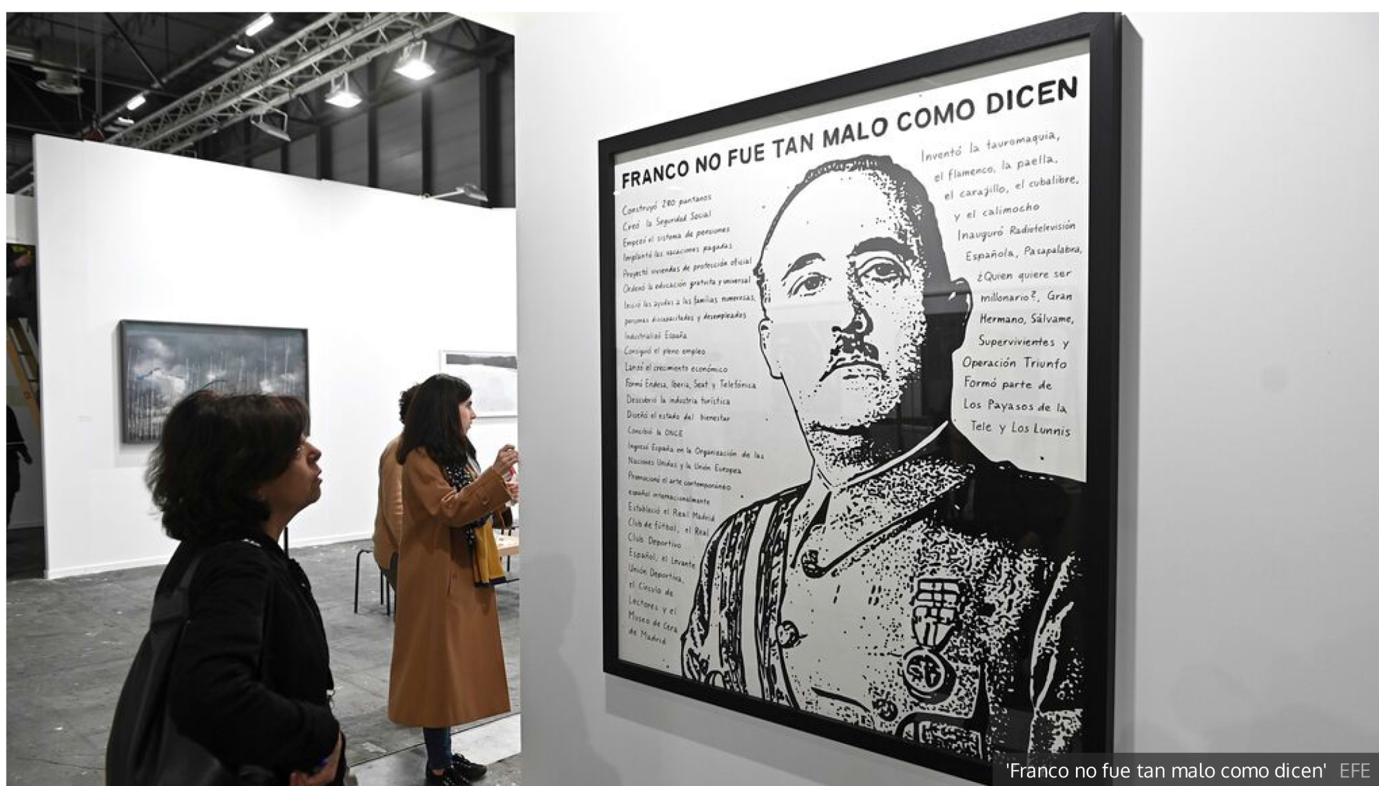
'Franco no fue tan malo como dicen'

Un primer recorrido por la feria de arte contemporáneo muestra un objetivo más claro: menos show y más ventas