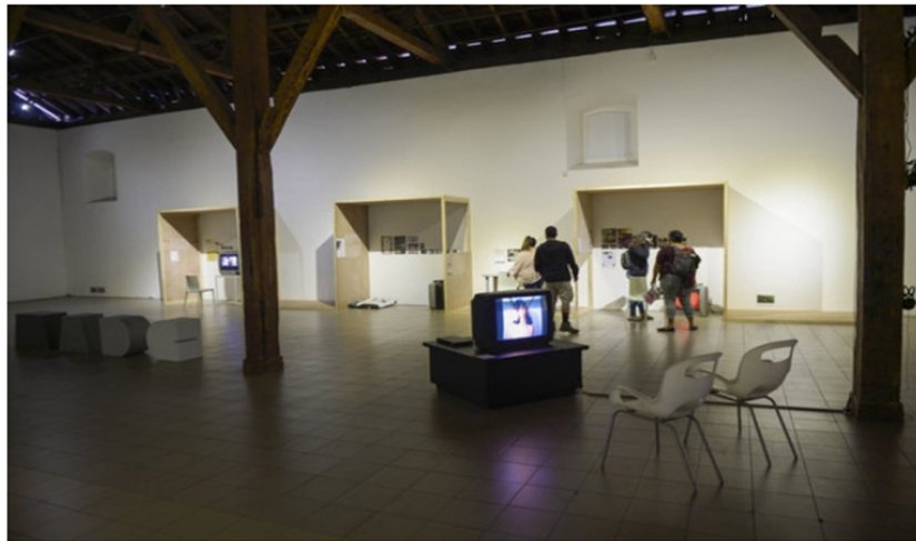
En la Sala 1, el MADC expone un recorrido documental de sus nueve ediciones Inquieta Imagen.