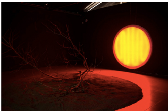
Instalación 'Paisaje conquistado' de Erno Hilarión.