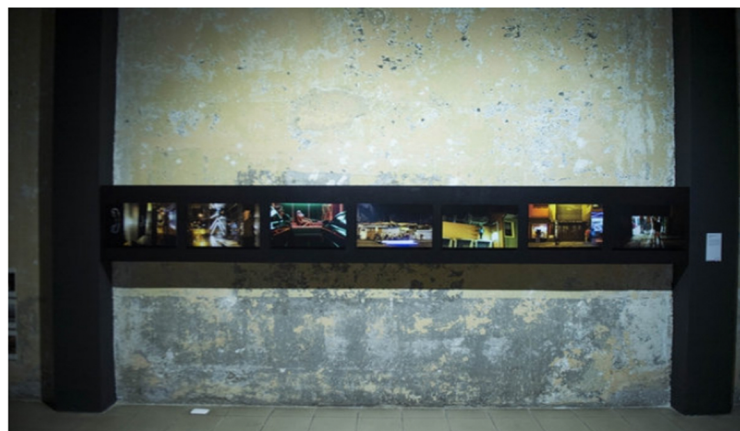
Fotografías de Adrián Arias 'Llamada perdida': una secuencia de fotografía documental preocupada con la textura de la noche.

La exposición estará abierta de martes a sábado hasta el 17 de febrero. El horario de visita es de 9:30 a. m. a 5 p. m.