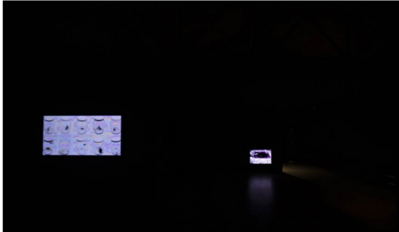
En primer plano, 'La cámara' de Andy Retana.

Mención: Andy Retana (Costa Rica). La cámara . Video, 2017.